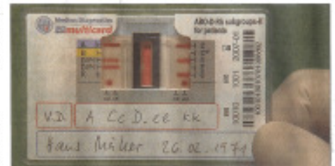
Auf der MDmulticard können zehn Blutgruppenmerkmale innert fünf Minuten bestimmt werden.

Die Ablesung sei nämlich einfach mit der Besonderheit, dass die Ergebnisse noch nach Tagen interpretiert werden können. Zu-